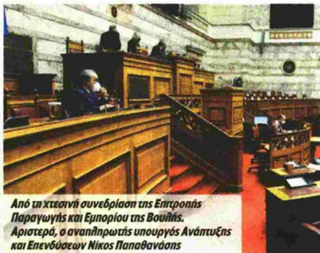
Από τη χθεσινή συνεδρίαση της Επιτροπής Παραγωγής και Εμπορίου της Βουλής. Αριστερά, ο αναπληρωτής υπουργός Ανάπτυξης και Επενδύσεων Νίκος Παπαθανάσης

Διακρίσεις εις βάρος των μικρότερων επιχειρήσεων παρατήρησε και η Πανελλήνια Ομοσπονδία Ξενοδόχων, ζητώντας από την κυβέρνηση να επαναθεωρήσει τη στάση